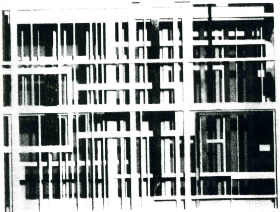
Paul de Guzman Poliester #20 (1998) deconstructed Poliester magazine 10.75" x 8.25"

C'est une collaboration avec l'inconnu. J'ai utilisé des instantanés trouvés pour faire des images et des installations. L'information est laissée telle quelle, transformée ou complètement desquamée. Ces espaces sont cloués, cousus et barbouillés ensemble pour créer des documents impersonnels de mon existence. – Clint Griffin