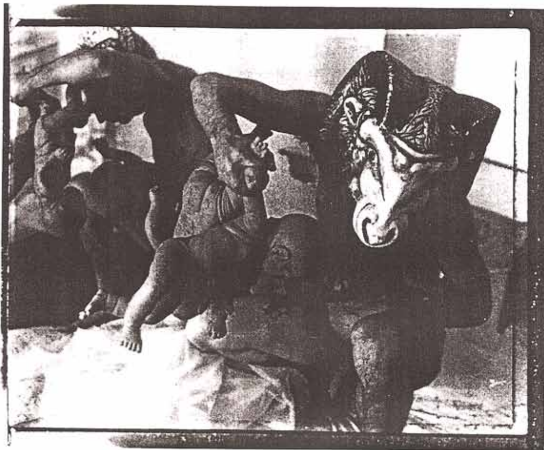
Evergon, Ramboy in Nursery with Mirror Image I , 1991. Photographie en noir et blanc; 138 x 164 cm.

Evergon, Galerie Trois Points/Jocelyne Aumont, Montréal. Du 6 septembre au 30 septembre 1995