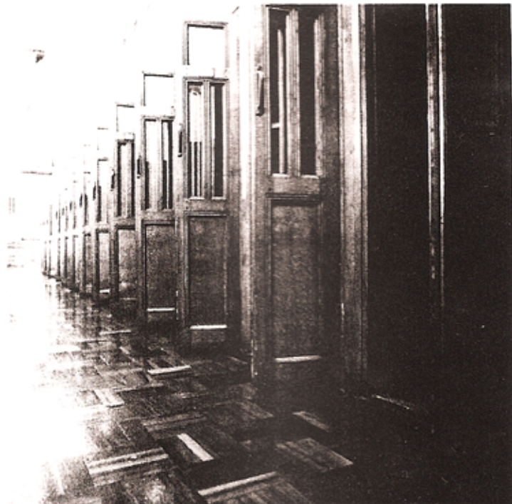
Jane & Louise Wilson. «Press Gallery, House of Lords: Parliament». 1999. Epreuve couleur montée sur aluminium.. C-print on aluminium

French governmental body for the arts), a partnership with the highly international Festival of Light, the direct participation of Scandinavian countries, etc. Such magnanimous, fervent and non-partisan involvement in the service of art and its international development deserves the highest praise. Whence the power of images? It is not an innate quality, but rather the effect of other powers that precede it and quantify it. This means, above all, those who own the means of information and run the spaces of expression. Consequently, as McLuhan demonstrated, it turns out to be impossible to reduce the question of the image's potential to its putative "content." The medium is also the message, of course, and we know that images are generated as much by the messenger as by the artist, i.e., those in charge of the particular medium, whether they be TV producers, ad agencies or exhibition space managers. Often the initial violence viewers feel in the face of an image comes from precisely this factor—the feeling of a well-orchestrated dispossession. Conscious of this political factor