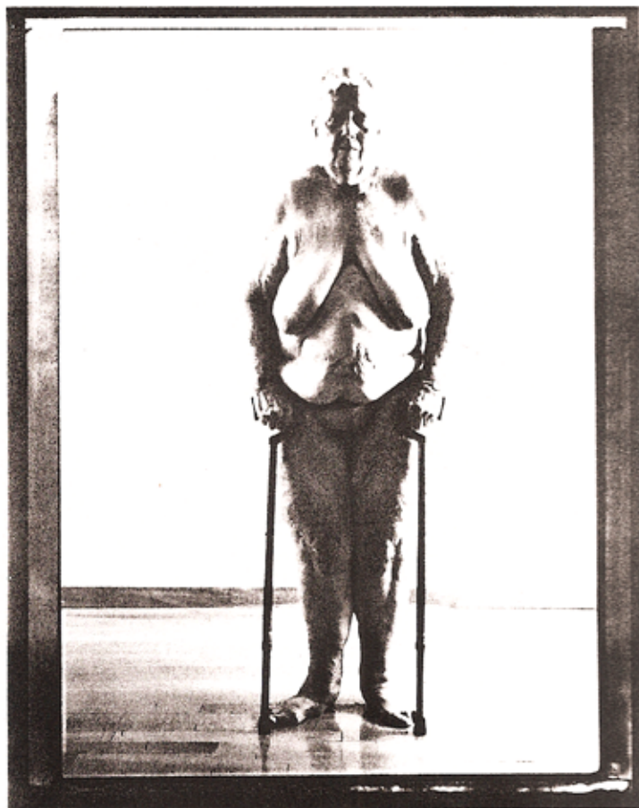
Evergon. «Margaret and I». 2000. Epreuve argentine à la gélatine. Silver gelatin print

With a selection of more than 130 artists, some 50 exhibition venues and a rich panoply of theoretical resources in the form of various lectures and talks, this seventh Montreal photography biennial will certainly be remembered as one of this year's outstanding art events. Further, even aside from the proliferation of offerings and artists, this is an event which has proven itself for three good reasons. First, lead curator Marie-Josée Jean opted for an undeniably hot theme, the power of images, certainly a familiar one but here directly interpreted by the images themselves. Second, the topic was considered not only from the angle of photography (art and otherwise) itself but also in terms of the way photography is enriched (and thrown into question) by its sister media, video and movies. Third, it was the occasion for an enormous convergence of energies, some of them local (almost every organization on the Montreal art scene was mobilized, which would have been unthinkable in Paris) and others arising from beyond North America: the French Season in Quebec, organized by the AFAA (a