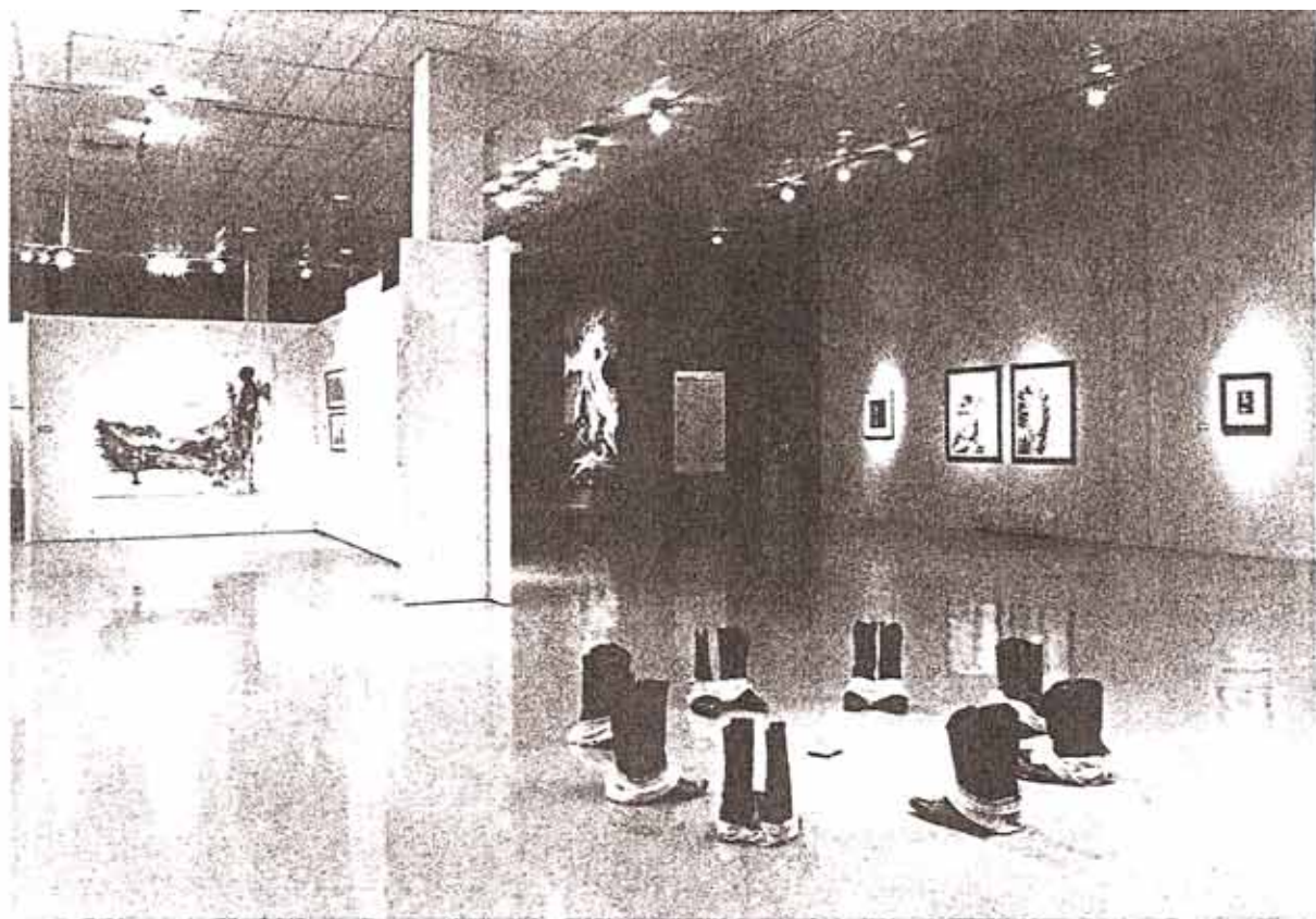
« La Drogue ». Le centre de l'exposition. Dessin et aquarelle de Janyardine

souvent dénaturées dans l'imagerie populaire par un érotisme exacerbé, voire avec une certaine violence même. Même sentiment de revendication de l'idée de couple dans Son or Man , d'Angela Grossmann. La fluidité de la gestuelle de cette huile sur carton, et la fluidité des morphologies qui se diluent devant ou au fond d'une baignoire adoucit la relation ambiguë entre les deux hommes. En revanche, les œuvres d'Anne-Marie Labelle, autre artiste femme à participer à cette exposition, documente tel un reporter les gestes quotidiens des pratiques domestiques de couples d'hommes gays.