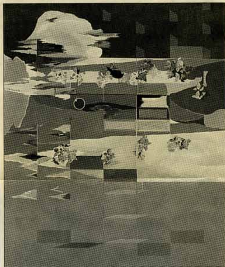
À ciel ouvert, 2006, de Michel Daigneault