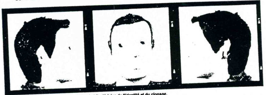
Superman (détail), d'Emmanuel Galland: Une habile dérision de l'identité et du clonage.

VOL. 11 N° 45 • DU 6 AU 12 NOVEMBRE 1997 • GRATUIT À MONTRÉAL